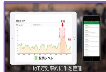
IoT導入事例紹介ビデオ