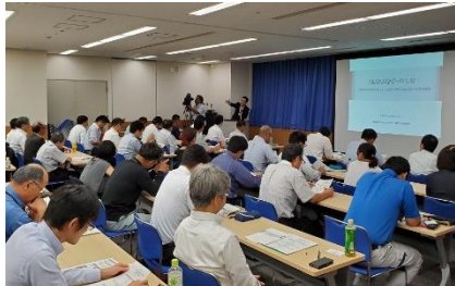
講師による説明の様子