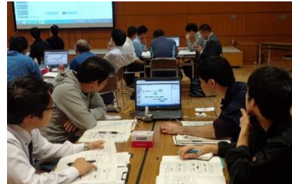
参加者同士によるデモ体験の様子

IoT導入活用における具体例やIoTセキュリティ対策の具体例の紹介等、受講ニーズや社会動向を踏まえたテキスト更新等を実施中