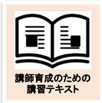
講師育成のための 講習テキスト